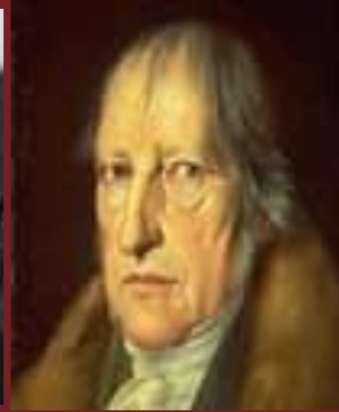
Γκεοργκ Βιλχελμ Φριντριχ Χεγκελ